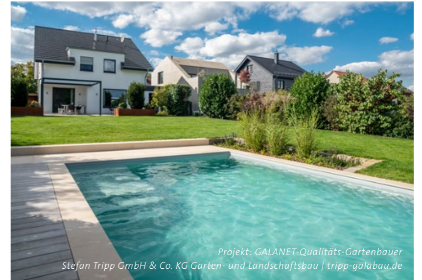
Projekt: GALANET-Qualitäts-Gartenbauer Stefan Tripp GmbH & Co. KG Garten- und Landschaftsbau | tripp-galabau.de

Mein persönlicher Glücks- ort entführt mich in eine eigene Welt. Eine Welt der Ruhe und Ausgeglichen- heit. Der Alltag: vergessen. In meinem Rückzugsort, der mir Kraft schenkt und mich glücklich macht.