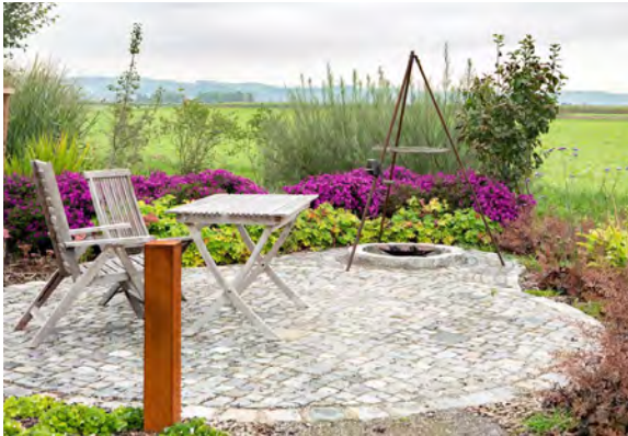
Projekt: GALANET-Qualitäts-Gartenbauer WURM GARTEN + LANDSCHAFT GmbH | wurm-garten.de