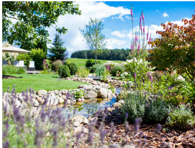
Projekt: GALANET-Qualitäts-Gartenbauer Hoppe Garten- und Landschaftsbau GmbH & Co. KG | hoppe-galabau.de