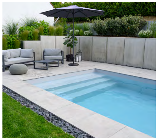
Projekt: GALANET-Qualitäts-Gartenbauer HOCHSCHOBBER GbR Gärten & Freiräume hochschober-galabau.de

Knauer GmbH Garten- und Landschaftsbau GALANET-Partner seit 2015