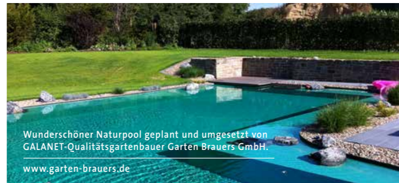
Wunderschöner Naturpool geplant und umgesetzt von GALANET-Qualitätsgartenbauer Garten Brauers GmbH. www.garten-brauers.de

Ein Naturpool benötigt im Gegensatz zum Schwimmteich keinen Regenerationsbereich mit Wasserpflanzen. Somit kann die komplette Fläche des Naturpools zum Baden genutzt werden.