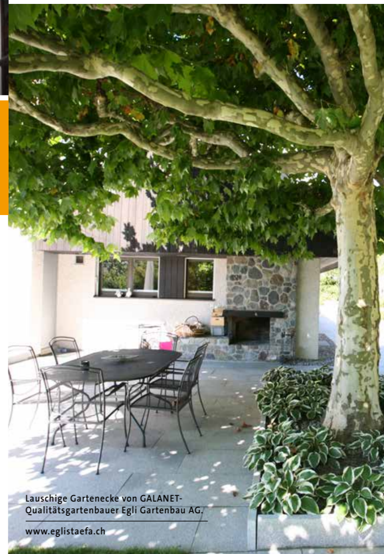
Lauschige Gartenecke von GALANET-Qualitätsgartenbauer Egli Gartenbau AG. www.eqlistaefa.ch

Schatten auf ganz natürliche Art und Weise erhalten Sie in Ihrem Garten mit einem Schattenbaum. Bei genügend Platz und mit dem richtigen Baum bekommen Sie Schatten ohne hohen technischen Aufwand. Als Schattenbäume eignen sich verschiedene Gehölze. Gerade Laubbäume sind der perfekte Sonnenschirm im Sommer. Mit ihrem dichten Laub halten sie in der heißen Jahreszeit die Sonne zurück. Im Herbst und Winter, wenn wir uns nach den wenigen Sonnenstrahlen sehnen, verlieren die Bäume ihre Blätter und lassen das wenige Licht der dunklen Jahreszeit hindurch. Lassen Sie sich von Ihrem GALANET-Qualitätsgartenbauer beraten und finden Sie den richtigen Schattenbaum für Ihren Garten. Denn schon ein altes Sprichwort besagt: „Vor dem Baum, der Schatten wirft, sollte man sich verneigen.“